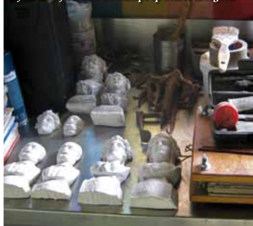
Afen toe zijn er ook workshops op Mares landgoed

"Mijn opvoeding, levenservaring en de verbouwing van mijn eerste huis