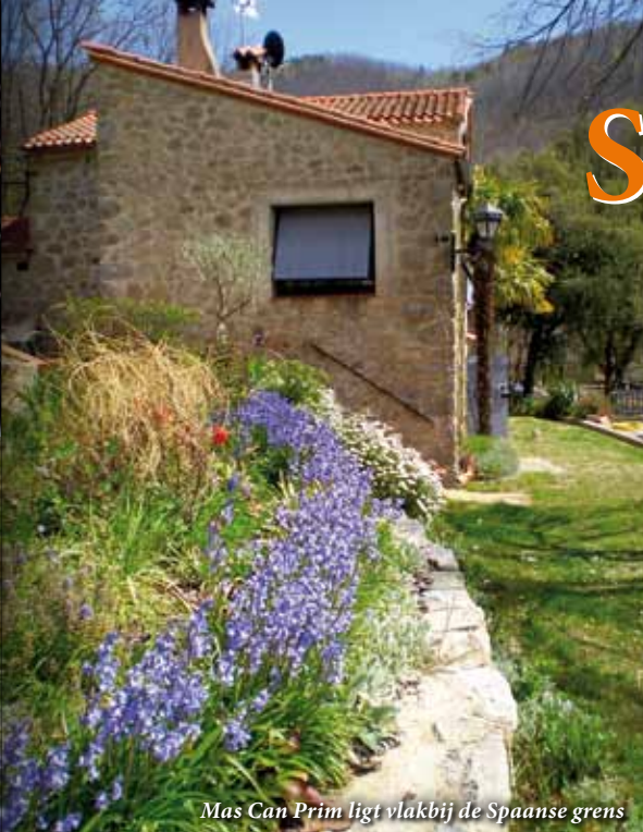
Mas Can Prim ligt vlakbij de Spaanse grens