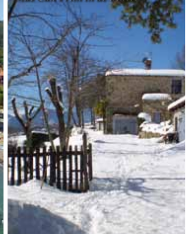
Mas Can Prim in de winter