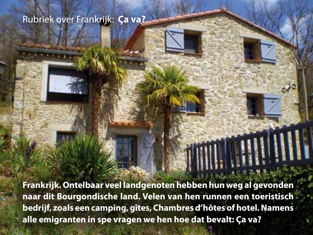
Frankrijk. Ontelbaar veel landgenoten hebben hun weg al gevonden naar dit Bourgondische land. Velen van hen runnen een toeristisch bedrijf, zoals een camping, gîtes, Chambres d'hôtes of hotel. Namens alle emigranten in spe vragen we hen hoe dat bevalt: Ça va?