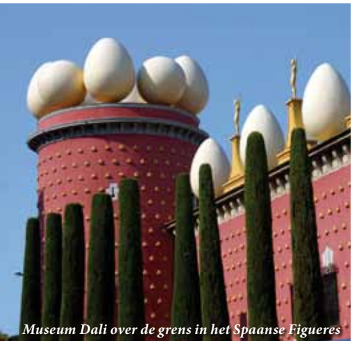
Museum Dali over de grens in het Spaanse Figueres