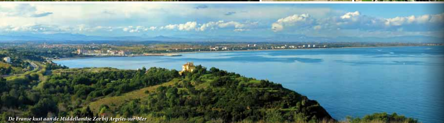
De Franse kust aan de Middellandse Zee bij Argelès-sur-Mer