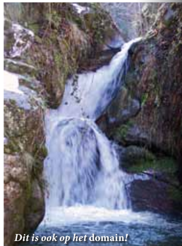
Dit is ook op het domain!